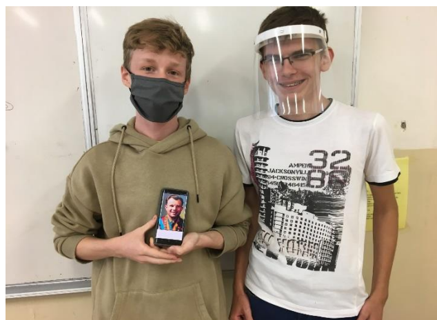
Ruský jazyk - V.B