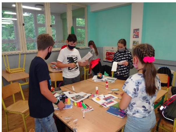
Nemecký jazyk – príme A