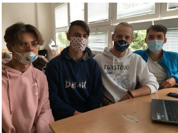
Ruský jazyk – oktáva A