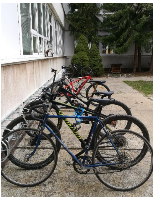
Do školy na bicykli