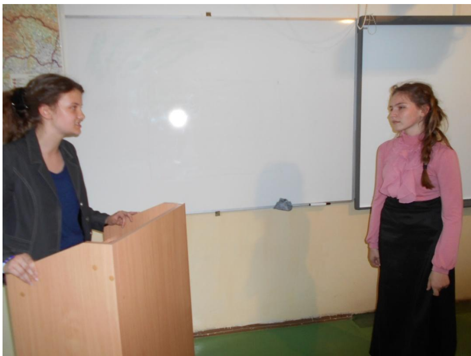
Obvinenia sú nespochybniteľné