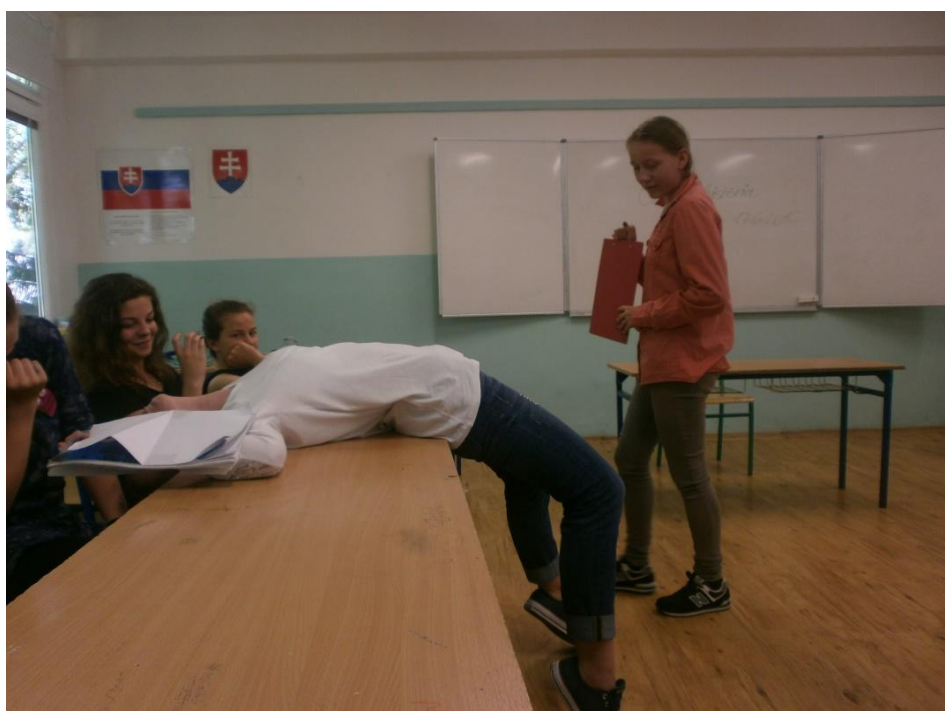
Vojna ruží zaujala nielen svojim názvom...