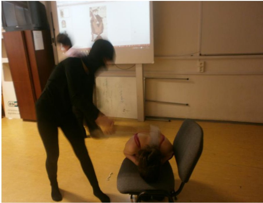
Alžbetínske Anglicko stína hlavu Márie Stuartovej