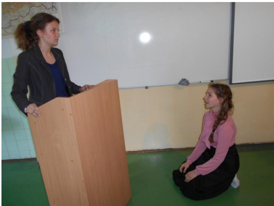
Nepomôže ani pokora, ani ľútosť, ani prosby