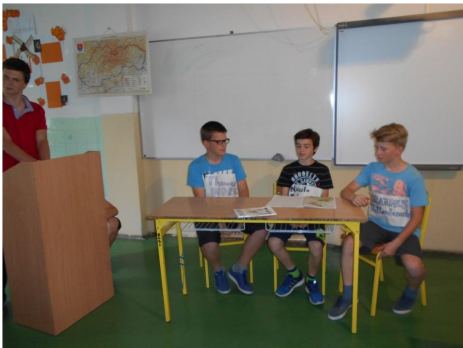
Významní filozofi sa zamýšľajú nad výchovou v duchu humanizmu