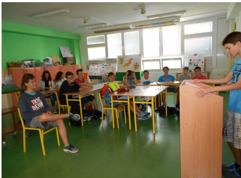
Správy o porážke uhorského vojska Tatármi prijímajú neprajníci s potešením