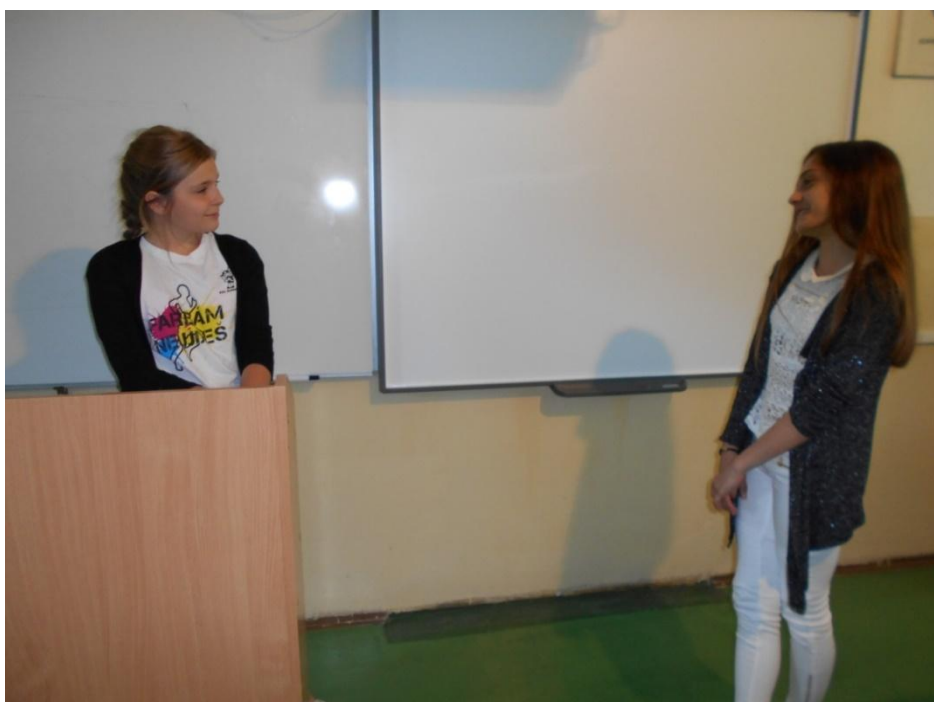
Hamlet a Ofélia v treťom dejstve a prvom obraze