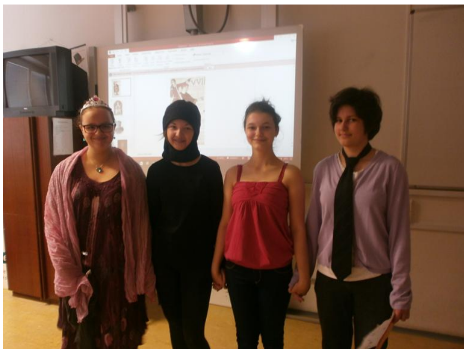
Dve kráľovné, jeden rozprávač a jeden kat...