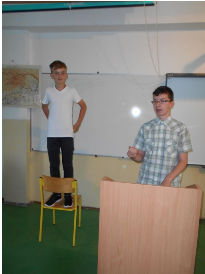
Majster Ján Hus na kostnickom koncile odmieta odvolať svoje učenie