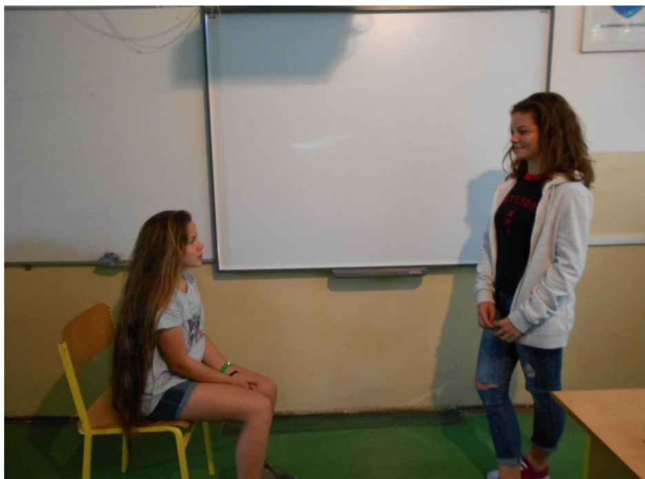
Krištof Kolumbus na španielskom kráľovskom dvore žiada o podporu