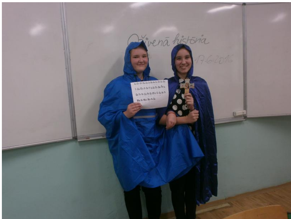
Na Veľkú Moravu prichádzajú vierozvestcovia