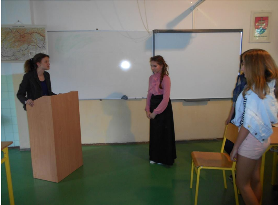
Vdova Capetová (Mária Antoinetta) pred revolučným tribunálom

História a hlavne jej vybrané kapitoly v podaní žiakov sekundy určite áno. Poslednou bodkou resp. bodkami za dejinami stredoveku a novoveku bolo oživenie zaujímavých udalostí z našej i európskej minulosti. Niektorí na to potrebovali nabrúsený jazyk, iní ostrý meč a boli aj takí, ktorým stačili len gestá, znaky či indicie. Viacúčelový rečnícky pult imitoval atmosféru v súdnej sieni, na zasadnutí uhorského snemu, na koncile v Kostnici..., skrátka zahral si ☺. A diváci sa činne prizerali – hádali historické hádanky, mená osobností, názvy udalostí, porovnávali a hlavne odmeňovali tvorivých a odvážnych potleskom.