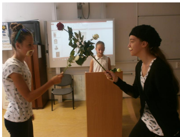
Vojna ruží a začiatok vlády Tudorovcov na anglickom tróne