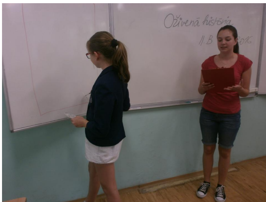
Vypočuj si vizitku umelca a povedz jeho meno